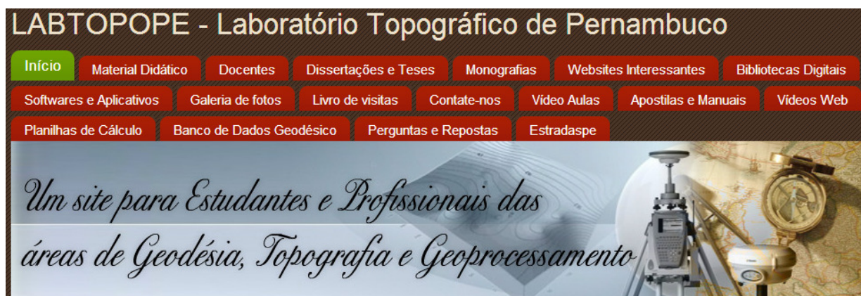
Figura 1 – Disposição dos Menus de acesso do site

A disposição dos menus no cabeçalho da página principal do site foi idealizada, objetivando deixar o usuário familiarizado o mais rápido com o layout do site, pois o mesmo se assemelha a abas de um fichário onde o usuário acessa as informações de forma organizada e independente, escolhendo o conteúdo desejado sem levar muito tempo para encontrá-lo. O layout do site foi inspirado, sobretudo na forma como a maioria dos estudantes comumente organizam seu material impresso de estudos, que é na forma de caderno, dividido por capítulos e temas, ou como fichários (Figura 1).